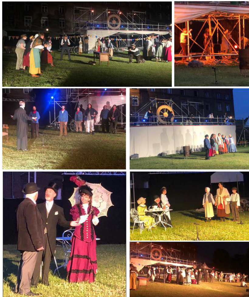
La grande première de ce spectacle a été jouée, jeudi 23 juin devant un public d'invités, d'élus et de partenaires avant les quatre autres représentations, qui affichaient complet déjà en début de semaine.

Alors que la nuit tombe sur le jardin de ce palais social, les lumières accompagnent le jeu de scène des 200 comédiens. Professionnels, amateurs, bénévoles, ne font plus qu'un pour porter ce projet devenu réalité. Il faut suivre d'un point à l'autre, se fondre dans cette époque, finalement pas si lointaine, retenir son souffle devant cette souffrance jetée face à la suffisance de l'autre côté. La chorale des enfants offre de belles respirations dans la mise en scène, accompagne la musique mise entre les mains de l'Harmonie municipale. Tous ont joué le jeu. Tous ont permis de faire germer cette petite graine. Une autre est en train de germer et va bientôt se dévoiler au grand public... la programmation culturelle du Familistère de la saison prochaine. Et là, bonne nouvelle, il y a encore des places ! Guise (02) Familistère. Ouverture de 10 h à 12 h 30 et de 13 h 30 à 18 h. Renseignements et réservations au 03 23 61 35 36. Ou en ligne www.familistere.com