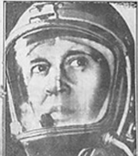
Chapeau de l'espace à l'entraînement

YOURI GAGARINE a fait le tour de la Terre en 1 heure 48 minutes