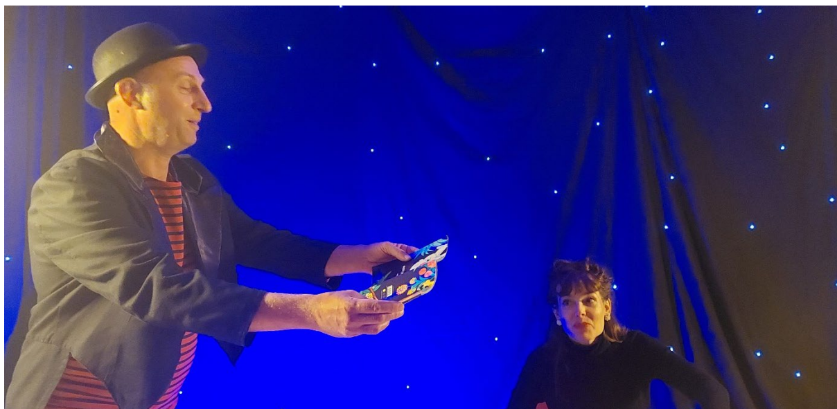
Première image de répétition. Jour 5.