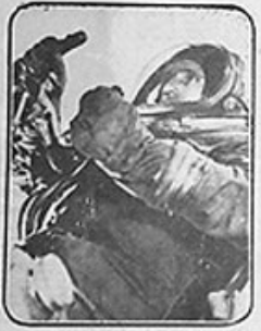
Le cosmonaute au cours d'une expérience