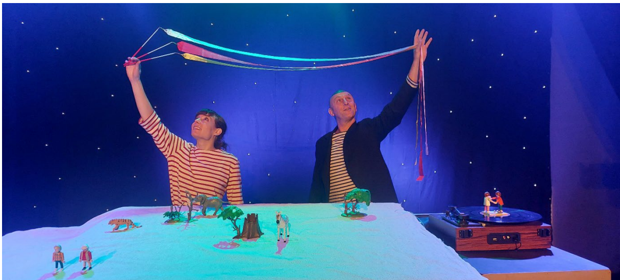
Répétition Jour 5.