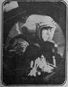
Le scaphandre de l'homme de l'espace