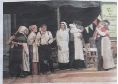
Les Françaises disent « au revoir » à leurs hommes, mobilisés pour la boucherie à venir.

"Weinachten" : le soir de Noël, les poilus français et allemands fraternisent.