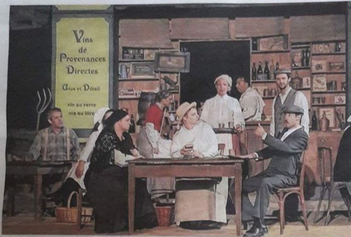
La pièce de théâtre "Sur le Chemin des Dames" se déroule dans plusieurs lieux en même temps : les tranchées du Chemin des dames bien sûr, mais aussi devant une exploitation minière, dans des champs... Ici, l'action se tient devant un café français, comme un clin d'œil à Pagnol. Textes et photos : Annick Boulton

CHIVRES-VAL La fresque historique "Sur le Chemin des Dames", jouée au fort de Condé, a été un franc succès. Certains soirs, notamment samedi, il n'y avait plus de place.