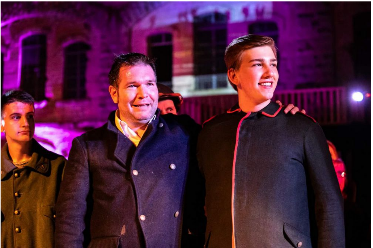
Pour la première fois depuis 100 ans sur le Chemin des Dames, la Compagnie Nomades réalise cet événement : un spectacle Franco-Allemand sur ce territoire ensanglanté.